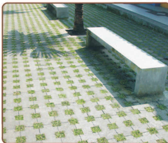
Todas las medidas son nominales en centímetros